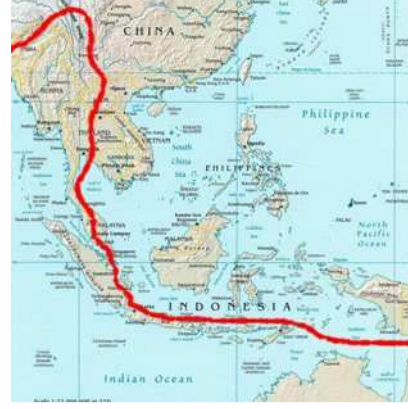
Asie du Sud Est