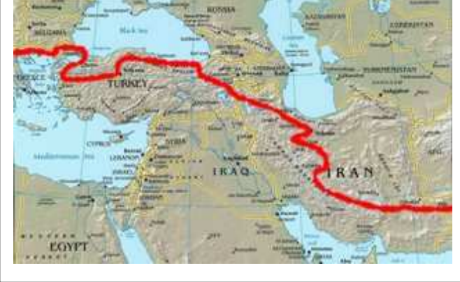
Asie centrale et Turquie