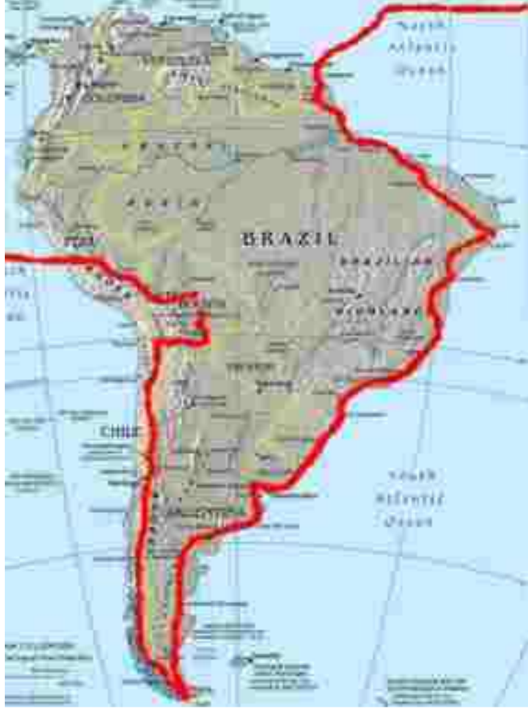
Amérique du Sud